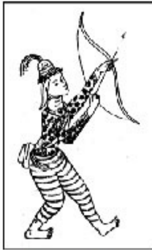
မြန်မာ့လေးထောင့်တပ်

လေးထောင့်ချိုင့်နံရံများမှ အတွင်းဘက်သို့ ဥမင်တူးသည် ။ နန္ဒာမညာဥမင် ကဲ့သို့သော အမျိုးအစားဖြစ်သည် ။