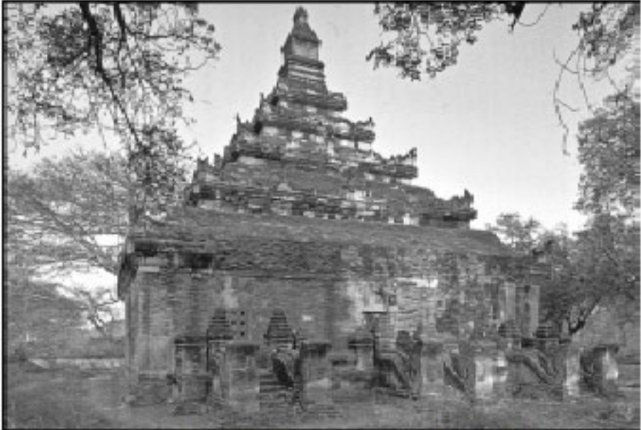
၁၇၈၄ ခုနှစ်က ပြန်လည် တည်ဆောက်ခဲ့သော ပိဋကတ်တိုက်

လောကမုနိ မြေဘုံသာ ဘုရားတွင် မူ အတွင်းဆင်းတုခန်းအစား မဏ္ဍိုင်အူတိုင်ထောက်ထားပြီး ထိုအူတိုင်၏ လေးမျက်နှာတွင် ဆင်းတုများ ပြုလုပ်ထားလေသည် ။ အလိုပြည့်ဂူနှင့် တောင်ဘီရွာအနောက် မွန်စာရှိသော ဂူများမှာ လည်း ထို့အတူ ဖြစ်လေသည် ။