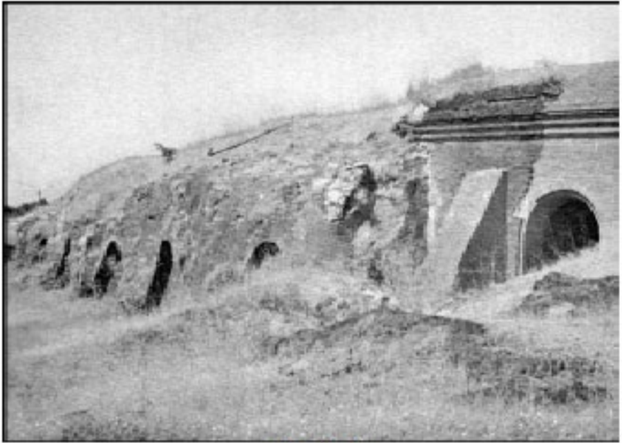
သမီးဝှက်ဥမင်